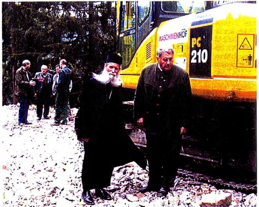
Der Erzbischof und sein Generaldirektor begutachten den Forststraßenbau in Baggerbauweise

Im Zuge der Restitutenen werden viele Ländereien vom rumänischen Staat