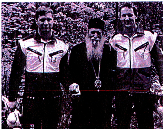
Österreichische Forstwirtschaftsmeister führen Erzbischof Pimen in verschiedene Arbeitstechniken ein

stein sowie Besichtigungen der Wallfahrtskirche Mariazell und Stift Kremsmünster. Ein Tag war für den neuesten Stand der Technik im Forststraßenbau reserviert. Der MASCHINENHOF, Langenwang, demonstrierte Erschließungen im Erd- und Felsbau. Verfahren in der Weginstandsetzung mittels Motorgrader und Walzenzug, auch in Kombination mit einer Gesteinsfräse wurden gezeigt.